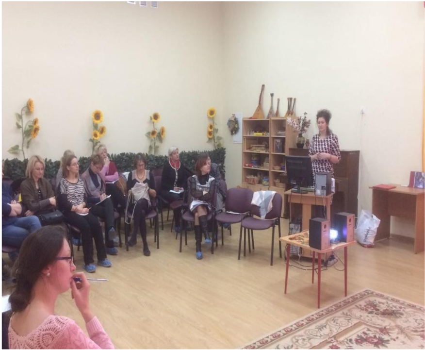
Мастер класс для коллег и родителей