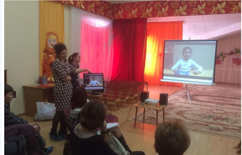
Семинар-практикум для родителей. «Выполняем правильно артикуляционную гимнастику - «Язычок веселый друг»

Важно научить родителей заниматься дома со своими детьми, совершенствуя речь своих детей.