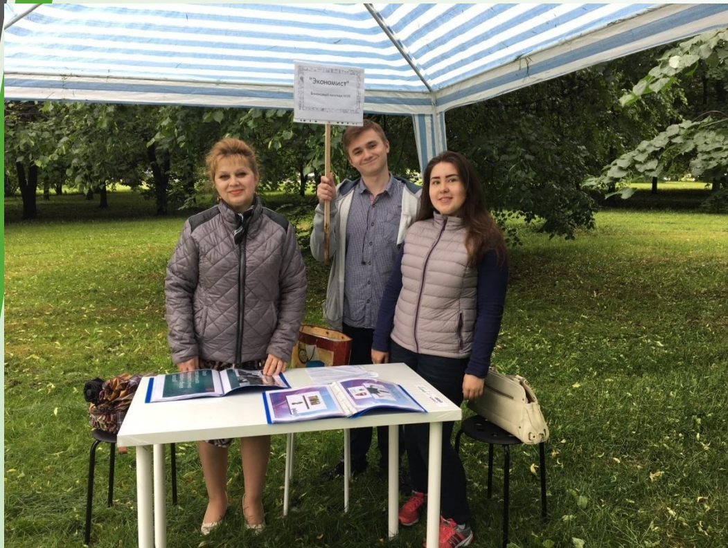
Волонтеры работали на станции «Экономист»