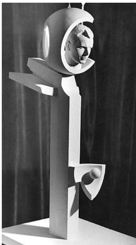
Макет высотой 1,5 м находится в музее им. Н.И.Гродекова