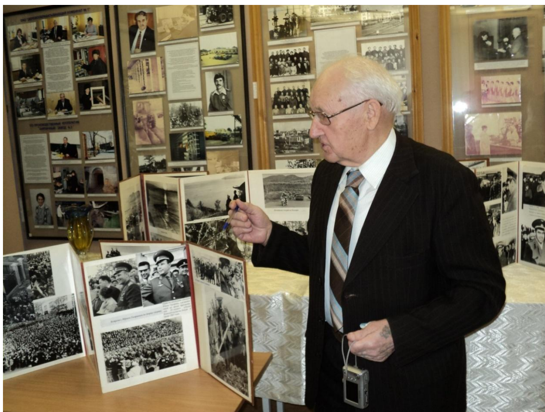
В. Ф. Пильгуев рассказывает о том, как он фотографировал первого космонавта в Хабаровске