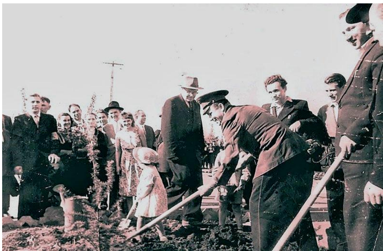
Ю. Гагарин в парке Индустриального района. 29 мая 1962 г.