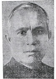
Н. С. ХРУЩЕВ. □□□□