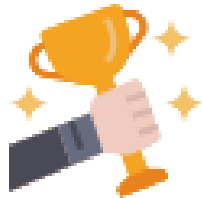
УСПЕШНАЯ И СЧАСТЛИВАЯ ЛИЧНОСТЬ