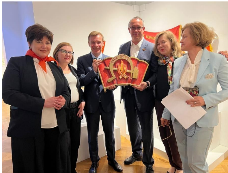
Выставка «Горн, барабан и пионерский галстук», Музей декоративного искусства, 19 мая 2022 г.