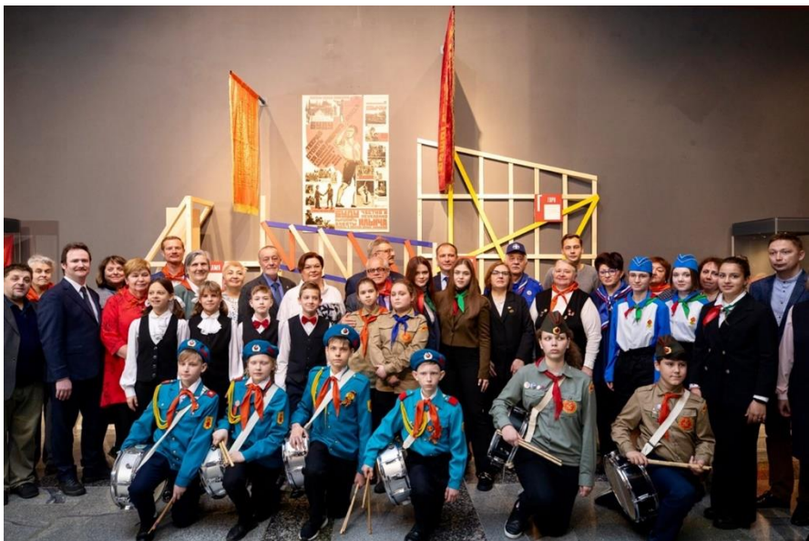
Выставка «Век пионерии», Музей Победы, 17 мая 2022 г.