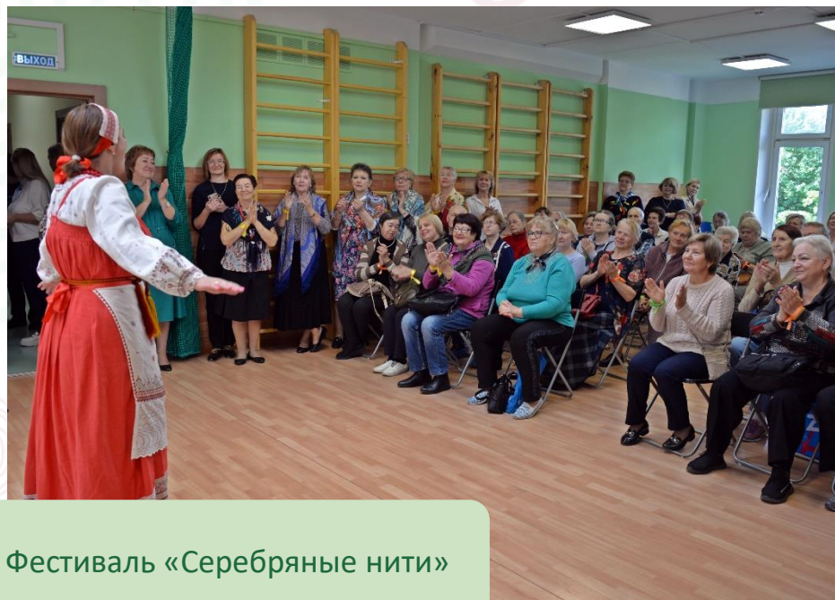
Фестиваль «Серебряные нити»