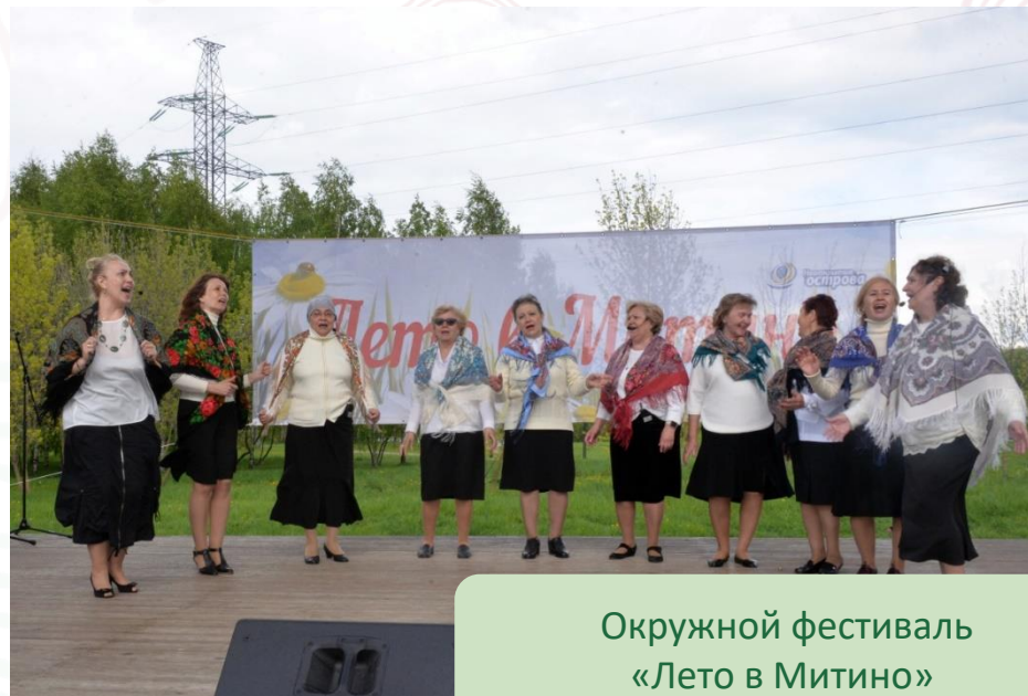
Окружной фестиваль «Лето в Митино»